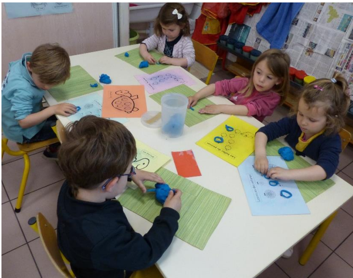
Réalisation de ronds en pâte à modeler