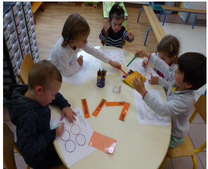
Tracer des ronds en repassant sur des pointillés