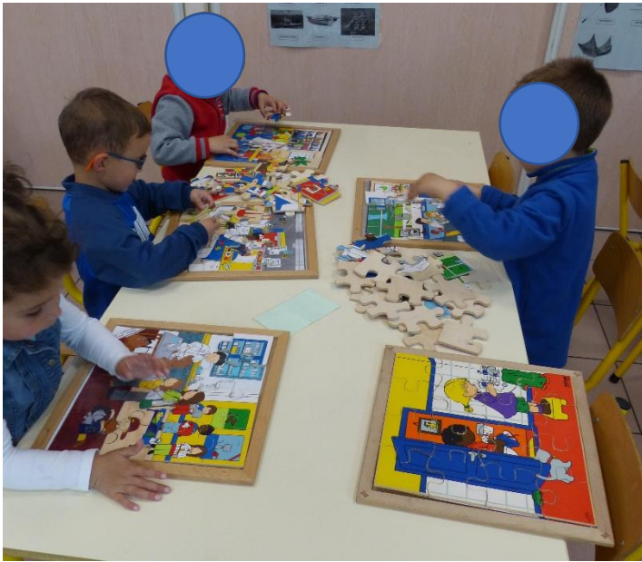
Puzzles avec des scènes de la vie quotidienne