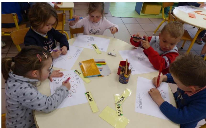
Dessiner des ronds pour faire les bulles du poisson