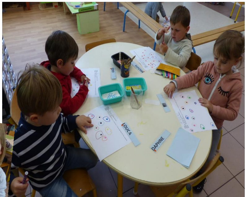
Coller des gommettes et tracer des ronds autour.