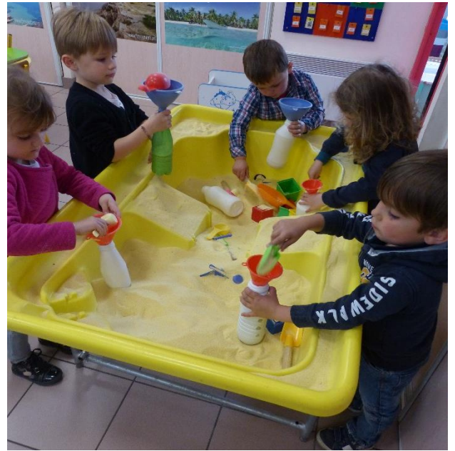
Transvasement de semoule