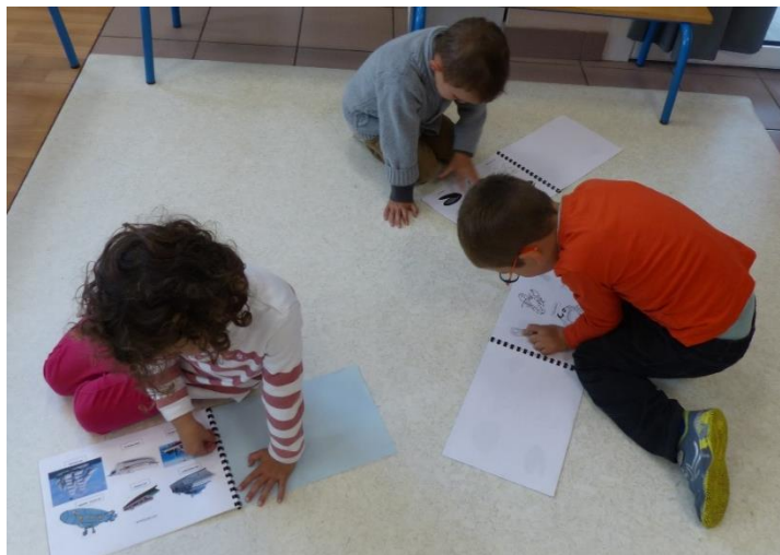
Lire dans l'imagier de la mer individuellement