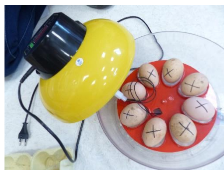
Il y a 8 œufs. La couveuse les retourne seule.

Il va falloir être patient jusqu'au 1 er avril. !!!! Les enfants n'ayant pas classe, Dominique a emmené la couveuse chez elle.