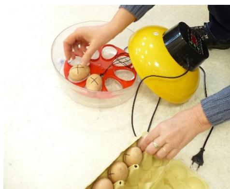
Installation des œufs dans la couveuse jeudi 12 mars