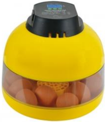
Mise en couveuse le 12 mars

Les poussins de la classe de Petite Section sont nés le 2 et 3 avril 2020.