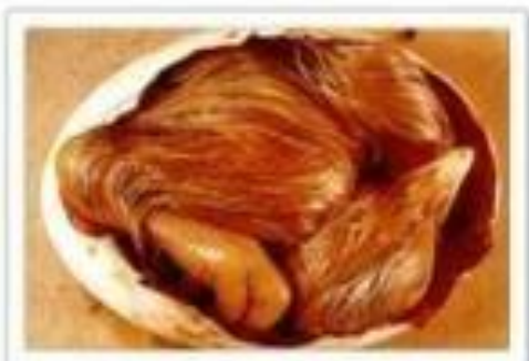
20ème jour d'incubation