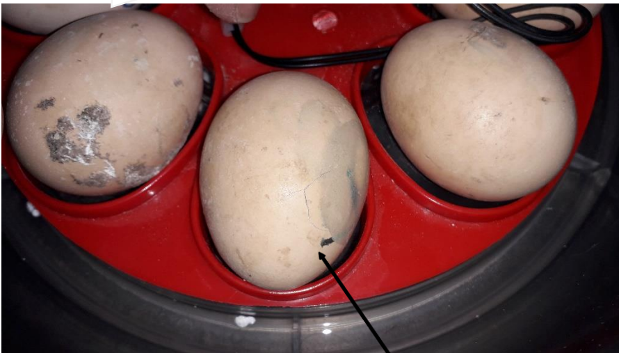
Petite fissure de l'œuf le 2 avril