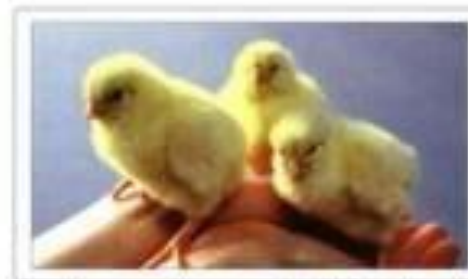
Une journée après l'éclosion