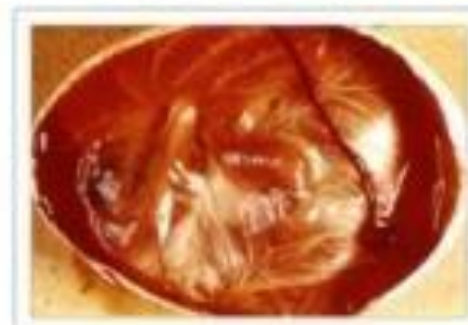
14ème jour d'incubation