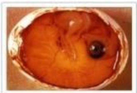
11ème jour d'incubation