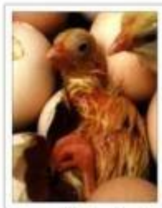
21ème et dernier jour d'incubation