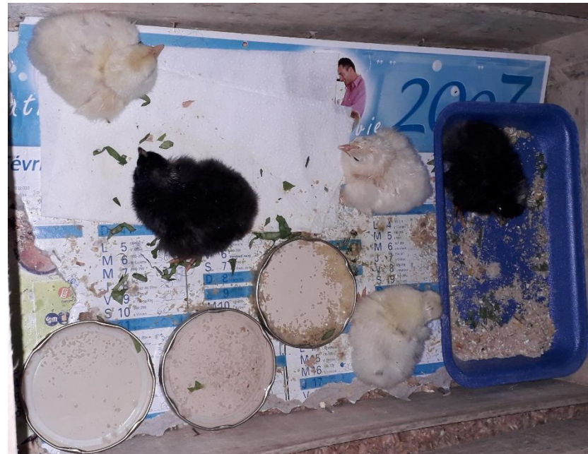
Les poussins naissent avec des duvets de couleurs différentes.