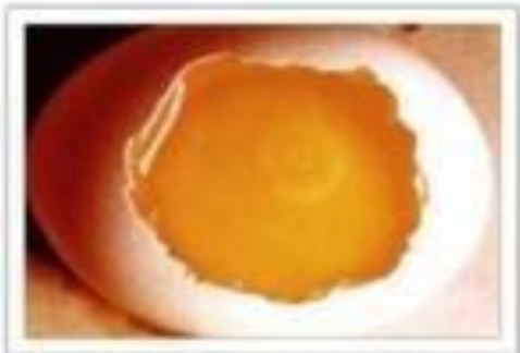
1er jour d'incubation

Voici quelques photos de ce qui se passe à l'intérieur de l'œuf pendant les 21 jours de couvain.