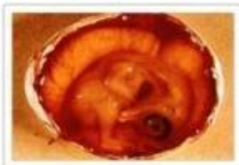
12ème jour d'incubation