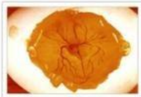
4ème jour d'incubation