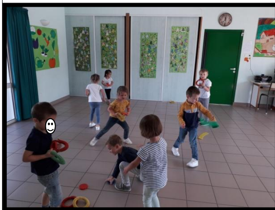
Nos journées d'école en quelques photos...