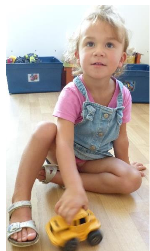
La salle de motricité