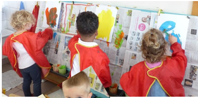
Les premiers coups de pinceau et de la lecture