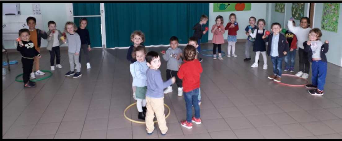
En phonologie, nous avons joué avec des instruments de musique. Un enfant devait fermer les yeux et essayer de localiser d'où provenait le son.