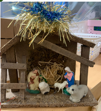
Installation de la crèche