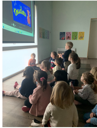
On écoute l'histoire de Toudou au marché et on apprend quelques fruits et légumes.