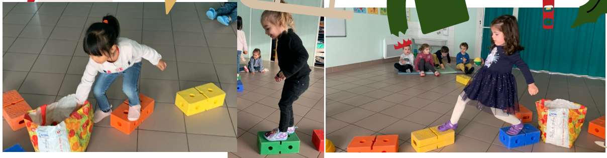
C'est parti pour le parcours sans mettre le pied par terre !