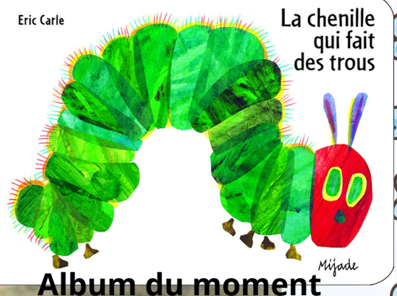
Album du moment