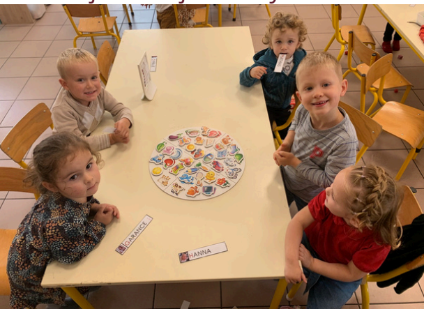
On joue au jeu du Lynx.