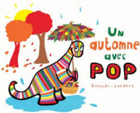
Nous rencontrons POP.