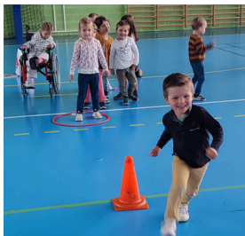
JEUX POUR COURIR