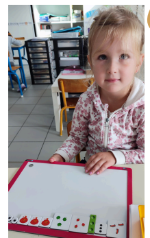
L'ARDOISE DU 3 ET LE MONSTRE A COMPTER JUSQU'À 5