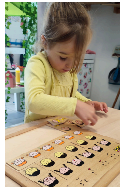
TABLEAUX A DOUBLE ENTREE