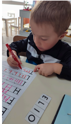
ECRITURE DE LETTRES DROITES