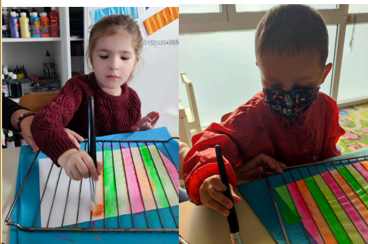
LES LIGNES OBLIQUES AVEC UNE GRILLE DE FOUR PENCHEE