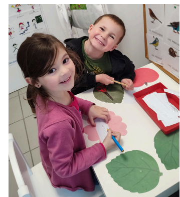
COIN ECRITURE POUR REMPLIR L'ARBRE A MOTS