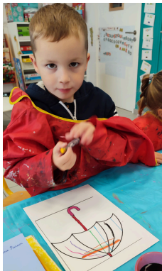
PARAPLUIES EN ARTS VISUELS