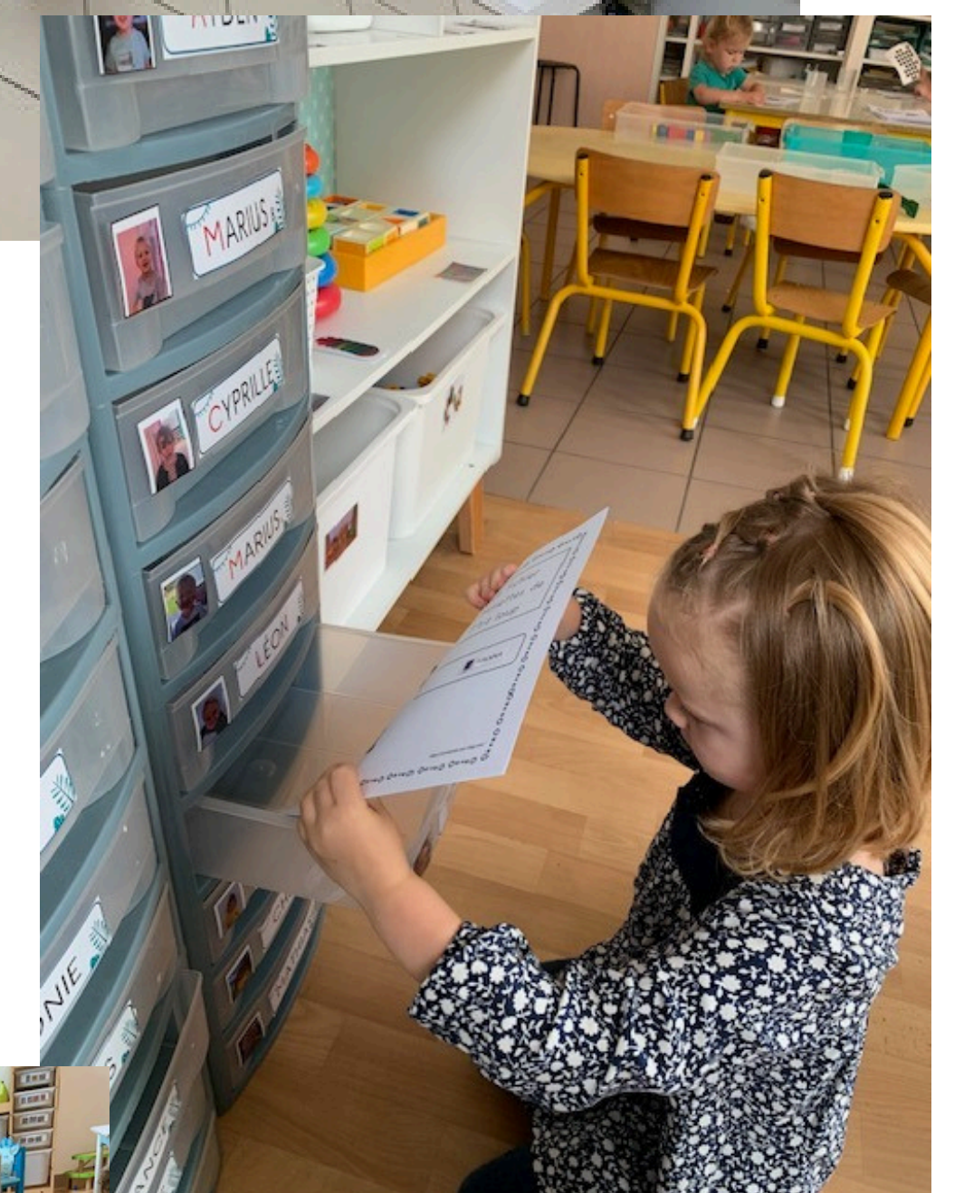
On apprend à ranger son travail