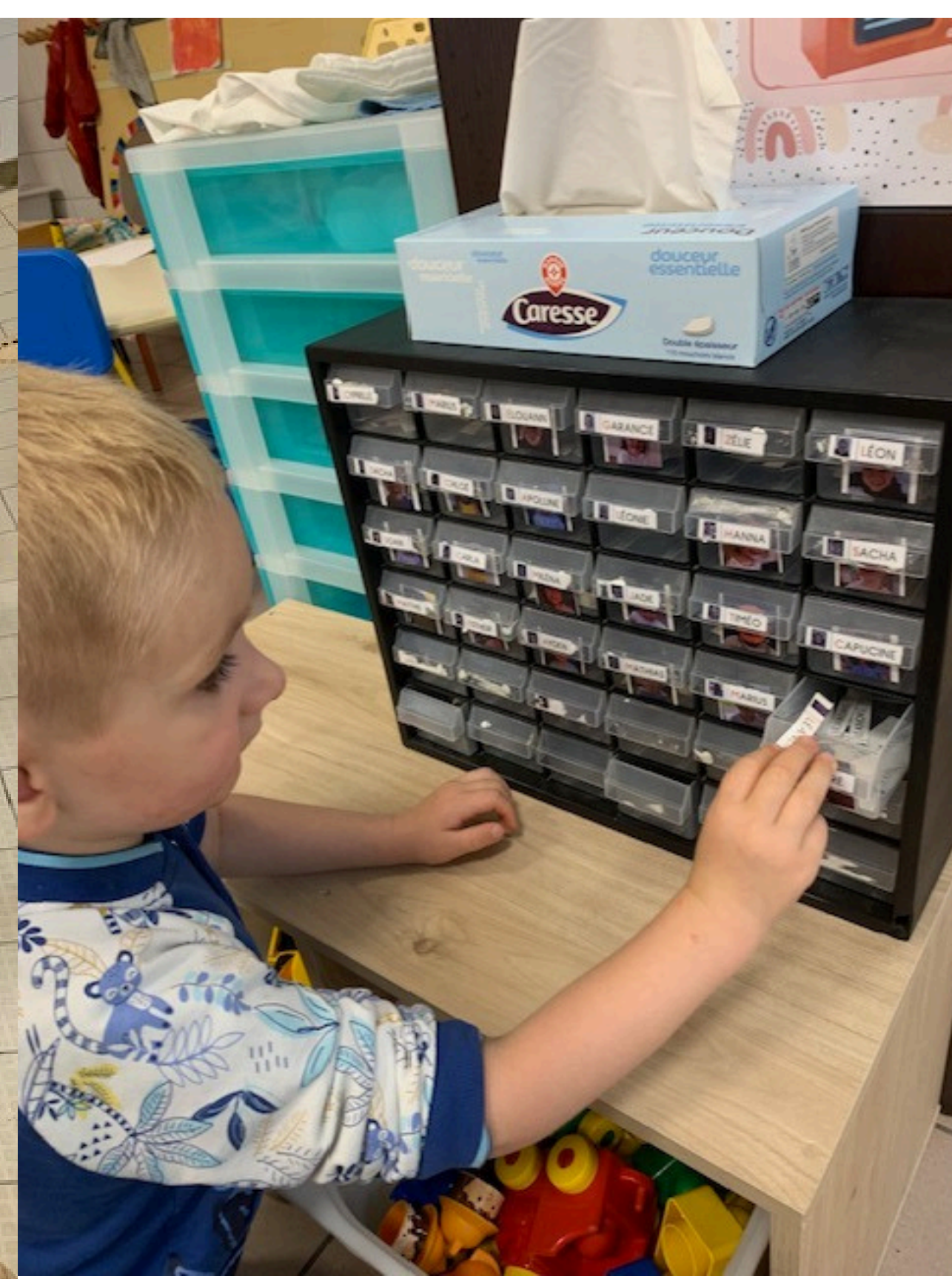
On apprend à trouver son prénom