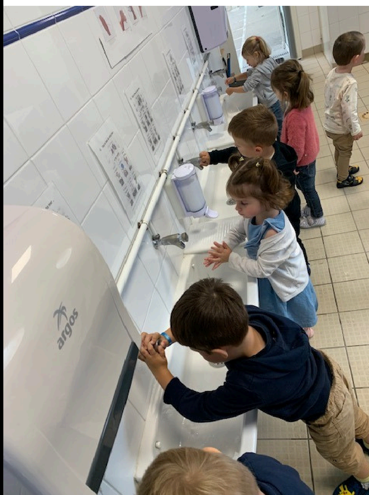
On se lave les mains

On instaure les premiers rituels et les premières règles de vie